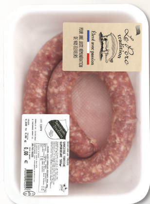
Saucisson Long Tranché

Env. 100g • Colis de 10 12609017 - 3264057557468